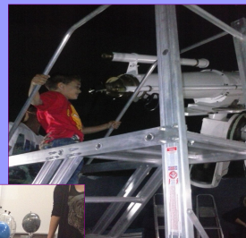
Observatório Dietrich Schiel : noite