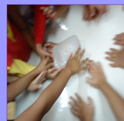
Sensório-motor "o gelão"